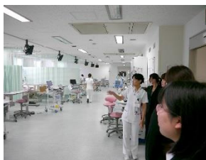
各病棟には専門の超急性期病床