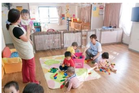
24時間体制でサポートの託児所

夜勤の際も安心して働いていただけるよう、24時間体制の託児所「さいわいほいくしつ」を完備。大切な子育てと仕事の両立をサポートいたします。