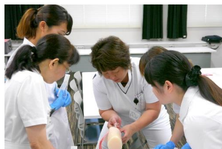
復職支援セミナー

当院では結婚や育児など、さまざまな理由で看護師の仕事から離れた人のために復職支援セミナーを実施しています。スムーズな復職のご支援とともに、さらなるステップアップのお手伝いをしております、